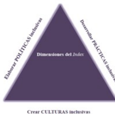
Figura 4. Las tres dimensiones del Index

Como venimos exponiendo, el Index invita a revisar y reflexionar sobre la práctica educativa a partir de la necesidad de explorarla en función de tres dimensiones de valoración interconectadas: